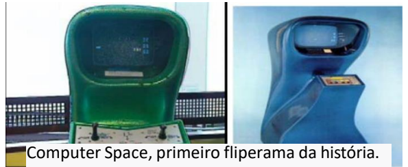
Computer Space, primeiro fliperama da história.

No início, os jogos eletrônicos eram bastante simples, com gráficos básicos e sem som. William A. Higinbotham criou um dos primeiros videogames, Tennis for Two (“tênis para dois”), em 1958.