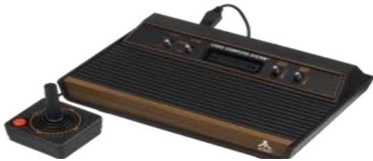
Atari 2600 foi um console de jogos eletrônicos popular no final dos anos 1970 e início dos anos

O jogo eletrônico, videogame ou videogame é aquele que usa a tecnologia de computador. Ele pode ser jogado em computadores pessoais (dentre eles tablets e telefones celulares), em máquinas de fliperama ou em consoles. Um console é um computador pequeno que serve basicamente para jogar videogame — PlayStation, Xbox e Wii são exemplos. Os consoles são conectados a controles manuais e a um aparelho de televisão. As pessoas podem jogar tanto sozinhas quanto acompanhadas.